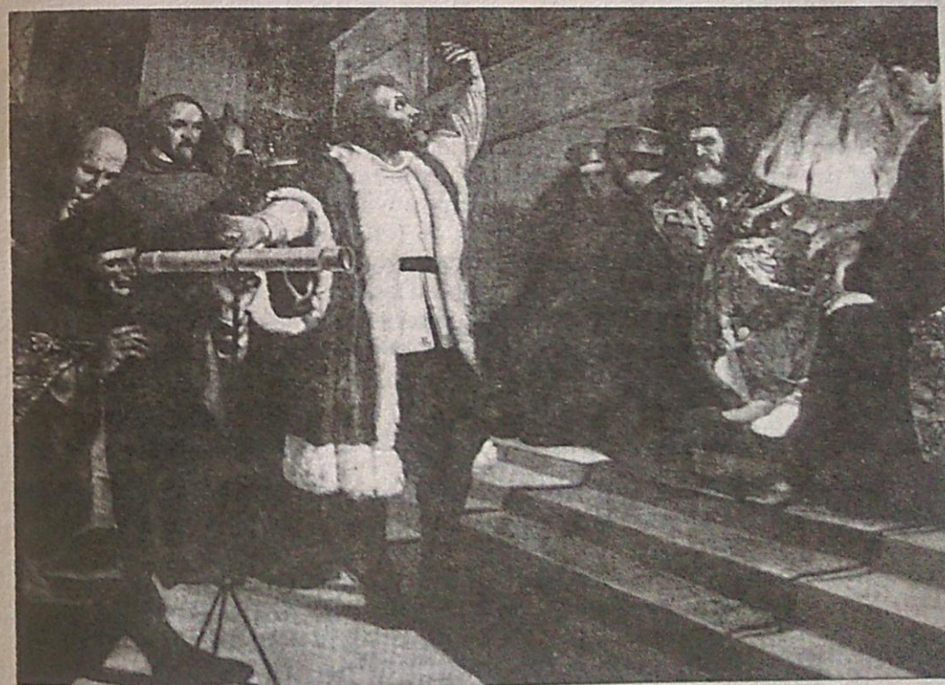
Las observaciones realizadas por Galileo utilizando el telescopio, que él perfeccionó, le permitieron fundamentar sus teorías astronómicas.

Este pensamiento de Galileo supuso un enfrentamiento con la Iglesia católica y su posterior condena.